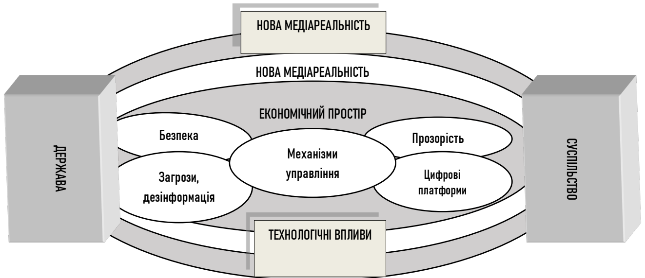
Рис. 2. Ключові проблеми формування нової медіареальності для механізмів управління соціальною безпекою цифрової держави

Визначено складові впливу нової медіареальності на ефективність механізмів державного управління соціальною безпекою, й окреслено ключові проблеми формування нової медіареальності для механізмів державного управління соціальною безпекою та шляхи їх розв'язання (Рис 2).