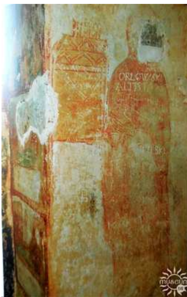
Рис. Ктиторская фреска; Евфросинии Полоцкой