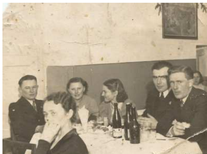
Фото 6. Святкування Різдва в Чеській Матіце шкільній. Луцьк, 1935 р.