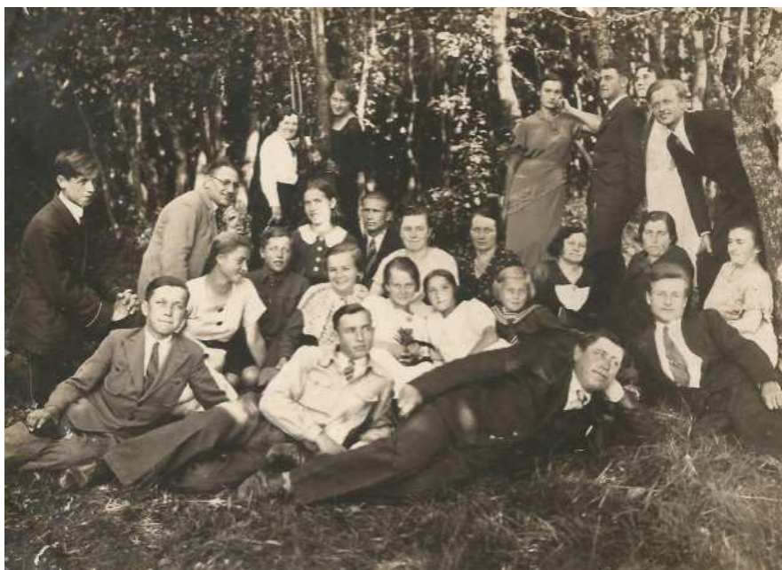
Фото 7. Члени товариства ЧМШ на відпочинку в Йозефіні поблизу Луцька. Орієнтовно 1938 р.