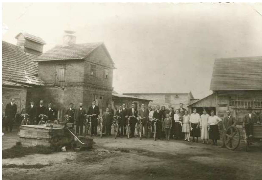
Фото 2. Підприємство Йозефа Прокупека. Луцьк, кін. 20-х – поч. 30-х рр. ХХ ст.