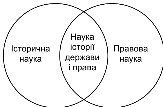
Рис.1 Місце науки історії держави і права в науковому пізнанні

сумнівно, такий дещо дихотомічний погляд на історію держави і права є цілком обґрунтованим і допомагає вирішити низку завдань методологічного спрямування. Однак, якщо виходити з точки зору, що основним джерелом дійсно об'єктивного знання про історію держави є історико-правовий документ, то відособленість держави і права як феноменів стає досить умовною. Інакше кажучи, в контексті історичного пізнання вивчення держави розпочинається й триває в історико-правовому полі. Таким чином, об'єкт і предмет історії держави і права як науки й навчальної дисципліни органічно поєднують історичне минуле й феномен права в самому широкому сенсі. Про правильність цієї тези свідчить і місце, яке посідає в науковому пізнанні історія держави і права. Схематично це можна відобразити наступним чином: