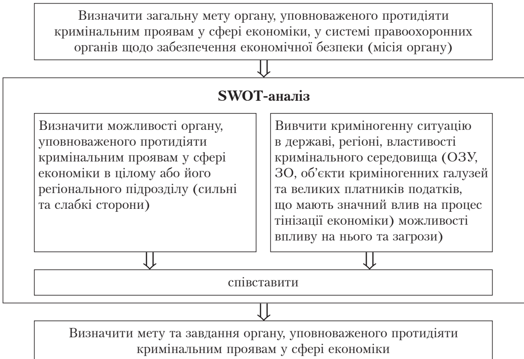
Рис. 1. Послідовність SWOT-аналізу

тегії? Якщо Служба не має переваг впливу на діяльність ОЗУ, ЗО, що вчинюють злочини у сфері економіки, то які з її потенційних сильних сторін можуть ними стати (підходи до боротьби, підтримка населення, технологічні можливості (доступ до потужних АПС, у тому числі до іноземних), розроблена ефективна методика розслідування злочинів, висококваліфіковані кадри, підходи щодо взаємодії та використанні ресурсів інших правоохоронних інституцій, значні повноваження, потужні оперативні позиції у кримінальному середовищі тощо)?