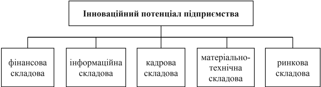
Рис. Структура системи оцінки інноваційного потенціалу підприємства

Оцінка інноваційного потенціалу здійснюється в усіх сферах діяльності організації: виробничій, науково-технічній, маркетинговій, ресурсній, організаційній й т. д. (рисунок).